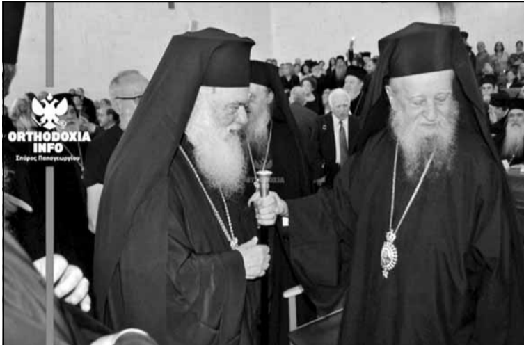
Ο Μητροπολίτης μας με τον Αρχιεπίσκοπο

Η εκδήλωση έγινε παρουσία του Αρχιεπισκόπου κ. Ιερωνύμου,