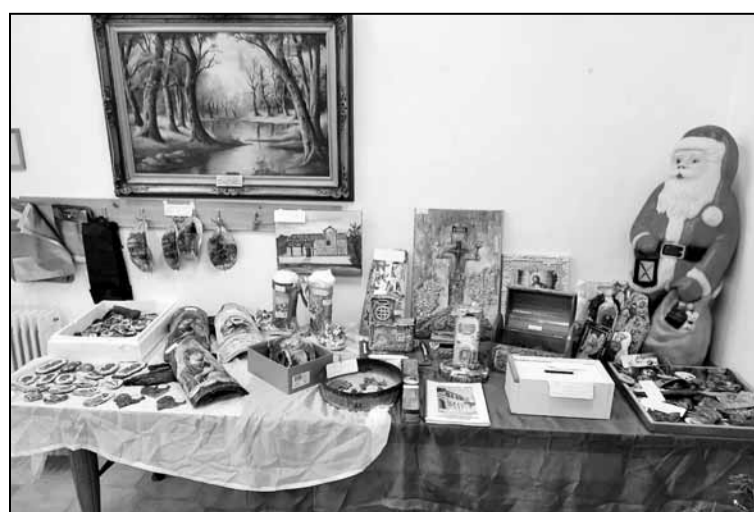
Τα περίτεχνα χειροτεχνήματα της Αναστασίας Κουμιμιτζή