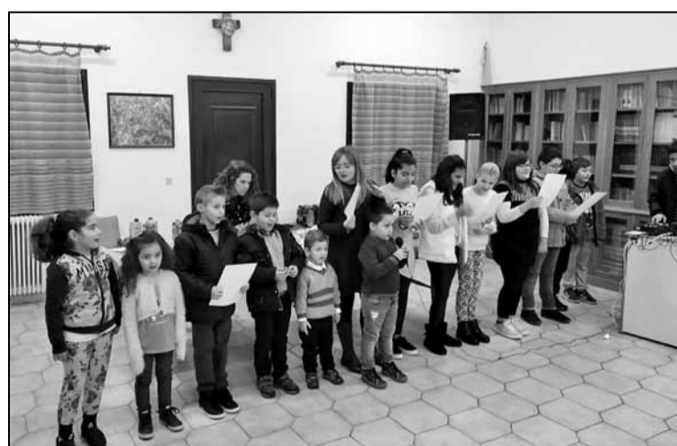
Τα παιδιά ψάλλουν τα κάλαντα